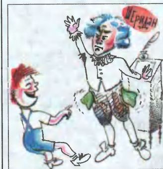
Рис. В. Плужникова

— Но, папа, — сказал циничный отпрыск, — ведь тебе нужно будет прежде где-то его занять!