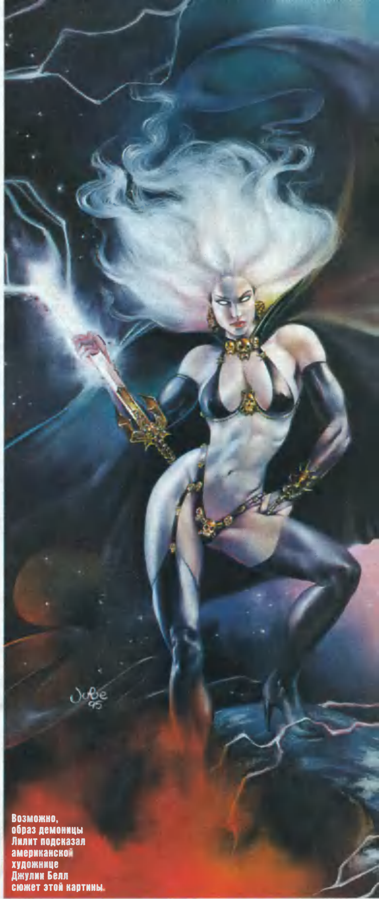
Возможно, образ демонницы Лилит подсказал американской художнице Джулии Белл сюжет этой картины.