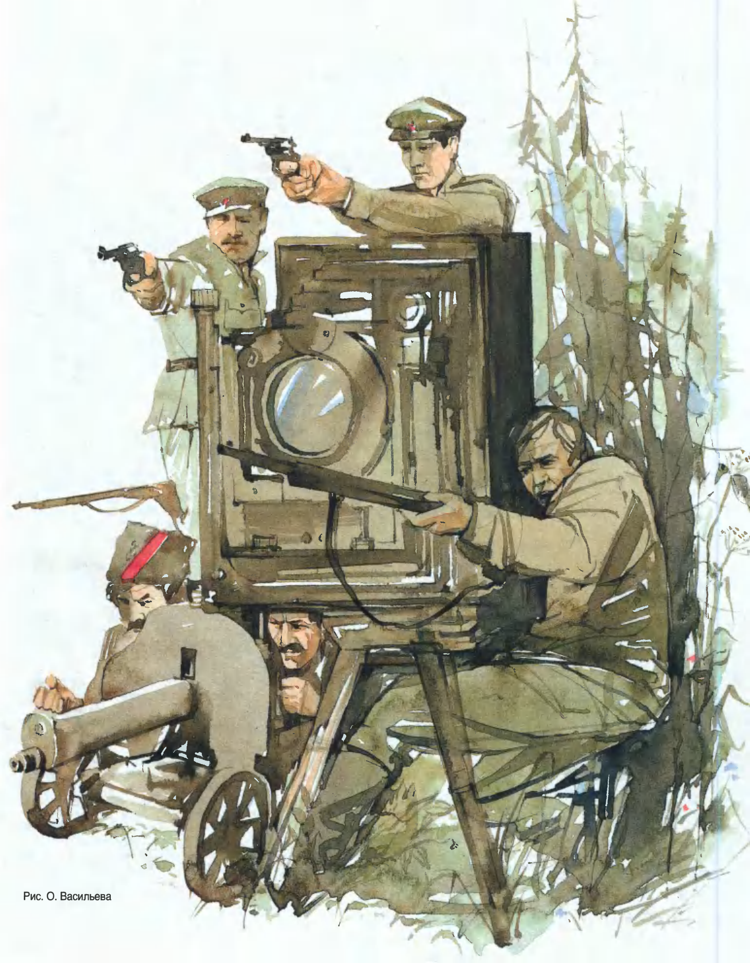
Рис. О. Васильева