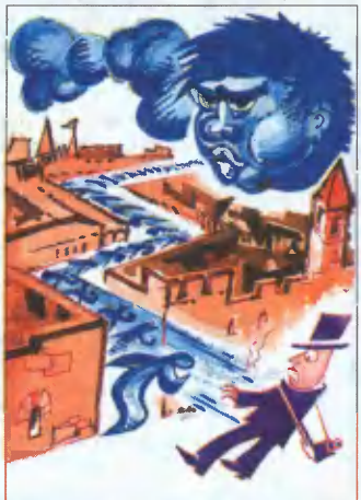
Рис. В. Плужникова