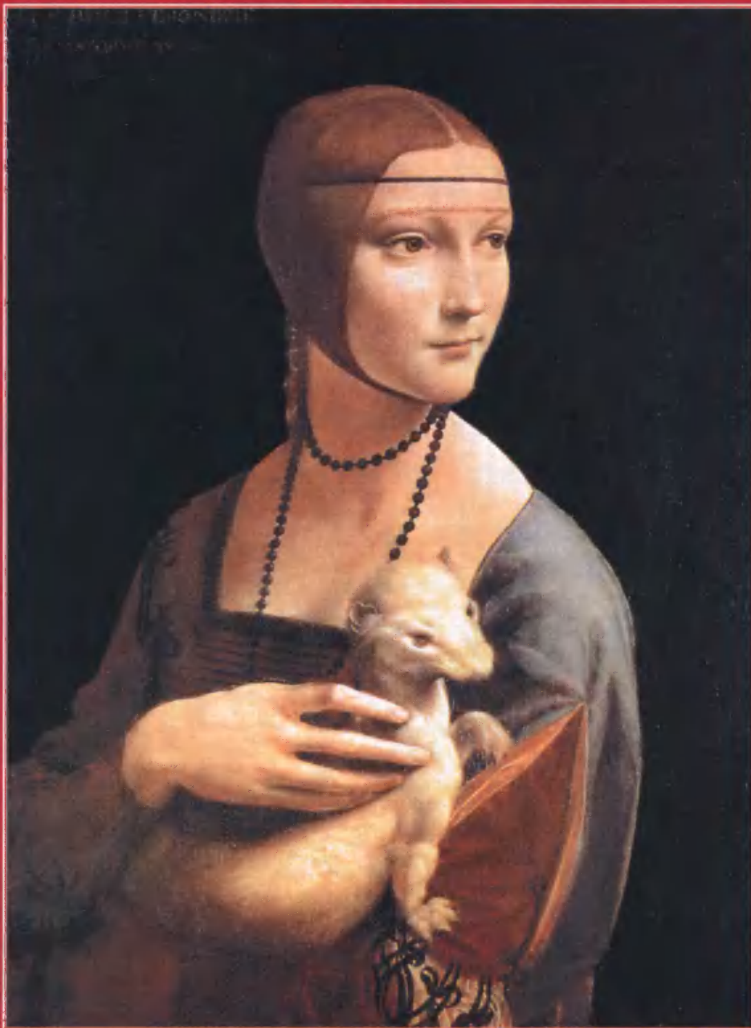
Леонардо да Винчи. Дама с горностаем.