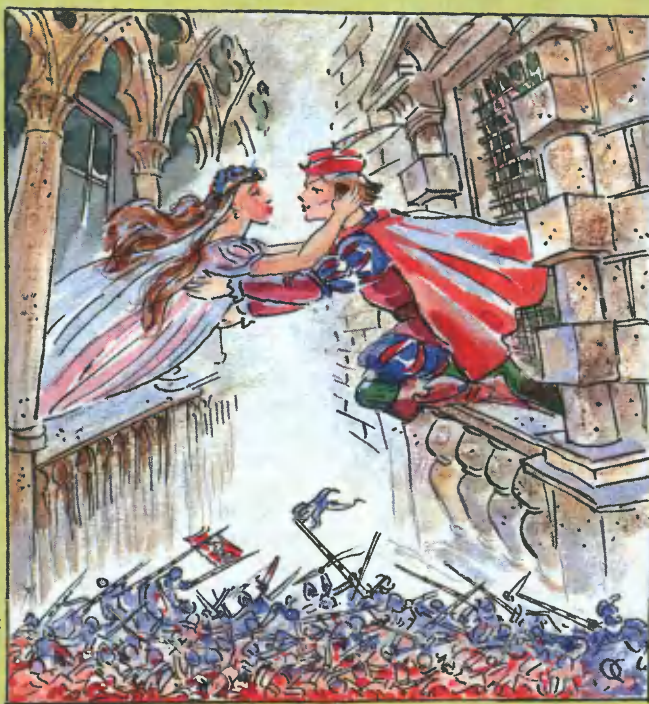
Рис. О. Сафронова

ной комедии», рассказывая о междоусобных столкновениях в Италии. Однако все попытки отыскать сколько-нибудь достоверные упоминания о реальных семействах Монтекки и Капулетти оказывались тщетными, пока американский историк Олин Мур не предложил остроумное решение этой головоломки. По его мнению, Монтекки и Капулетти — вовсе не собственные имена, а названия двух политических партий, точнее, их «местных ячеек», представлявших в Вероне главные соперничавшие группировки средневековой Италии — гвельфов и гибеллинов.