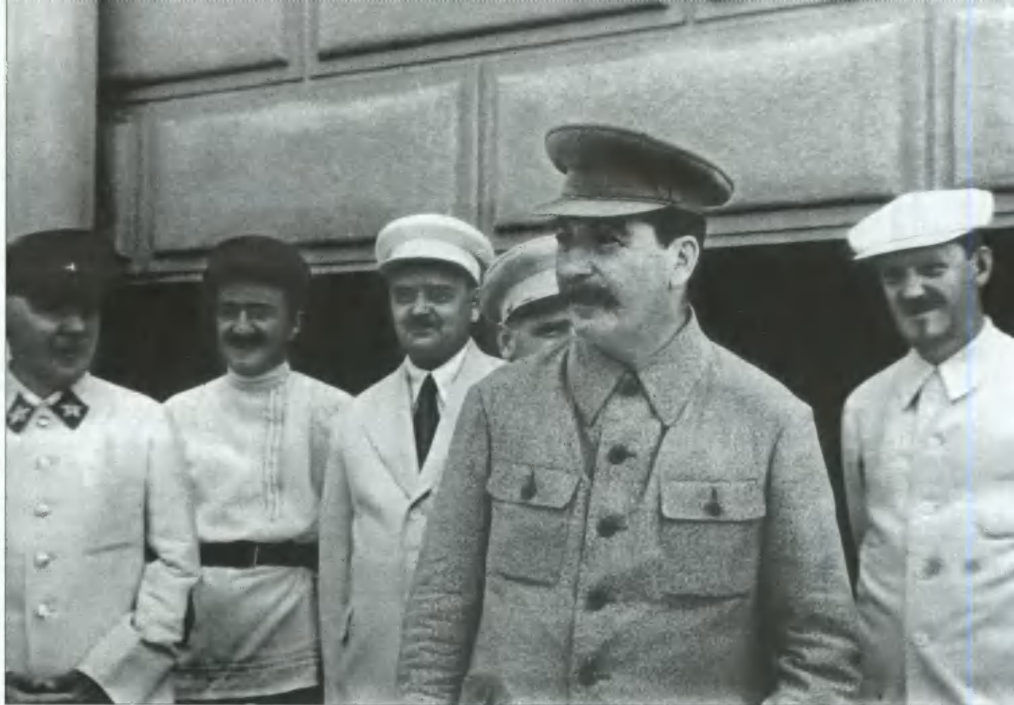
Май 1939. До начала войны осталось два года.

в расширении военных действий, а в устранении диктатора и заключении мира с западными союзниками.