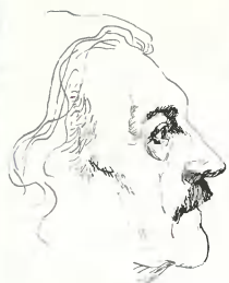
ЖУРНАЛ ОСНОВАЛ ВАСИЛИЙ ЗАХАРЧЕНКО В 1991 ГОДУ