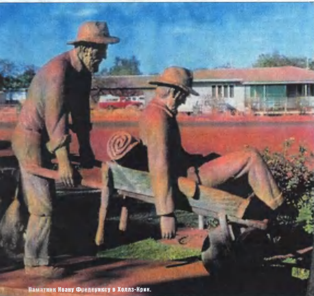
Памятник Ивану Фредериксу в Холлз-Крик.

В западноавстралийском посёлке Холлз-Крик перед административным зданием стоит необычный памятник. Крупный мужчина в одежде старателя времён австралийской золотой лихорадки везёт на двуручной тачке то ли раненого, то ли больного. Этот оригинальный памятник установили в 70-х годах XX века в честь нашего соотечественника Ивана Фредерикса, вошедшего в историю пятого континента под прозвищами Русский Джек и Геркулес из Мерчисона. Сегодня имя Фредерикса упоминается во всех книгах по истории штата Западная Австралия и даже в школьных учебниках. В России же имя этого человека, ставшего для австралийцев символом благородства, смелости и добродушия, абсолютно неизвестно.