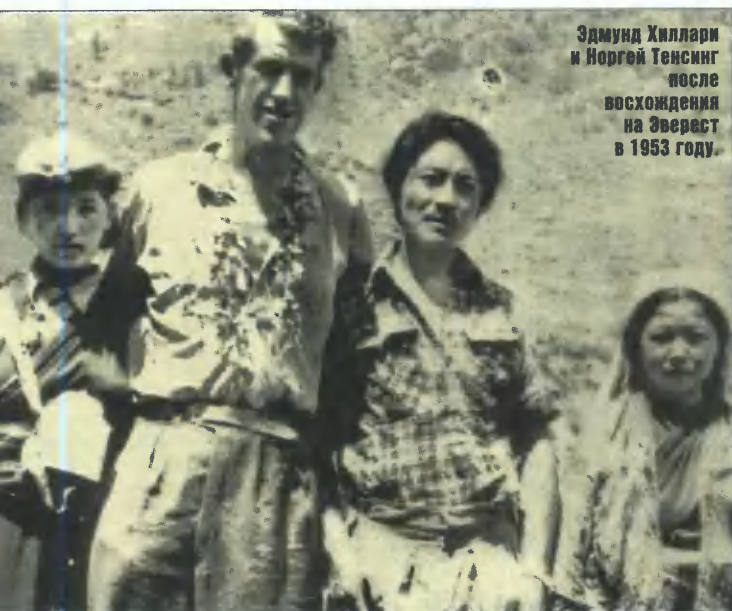
Эдмунд Хиллари и Норгей Тенсинг после восхождения на Эверест в 1953 году.